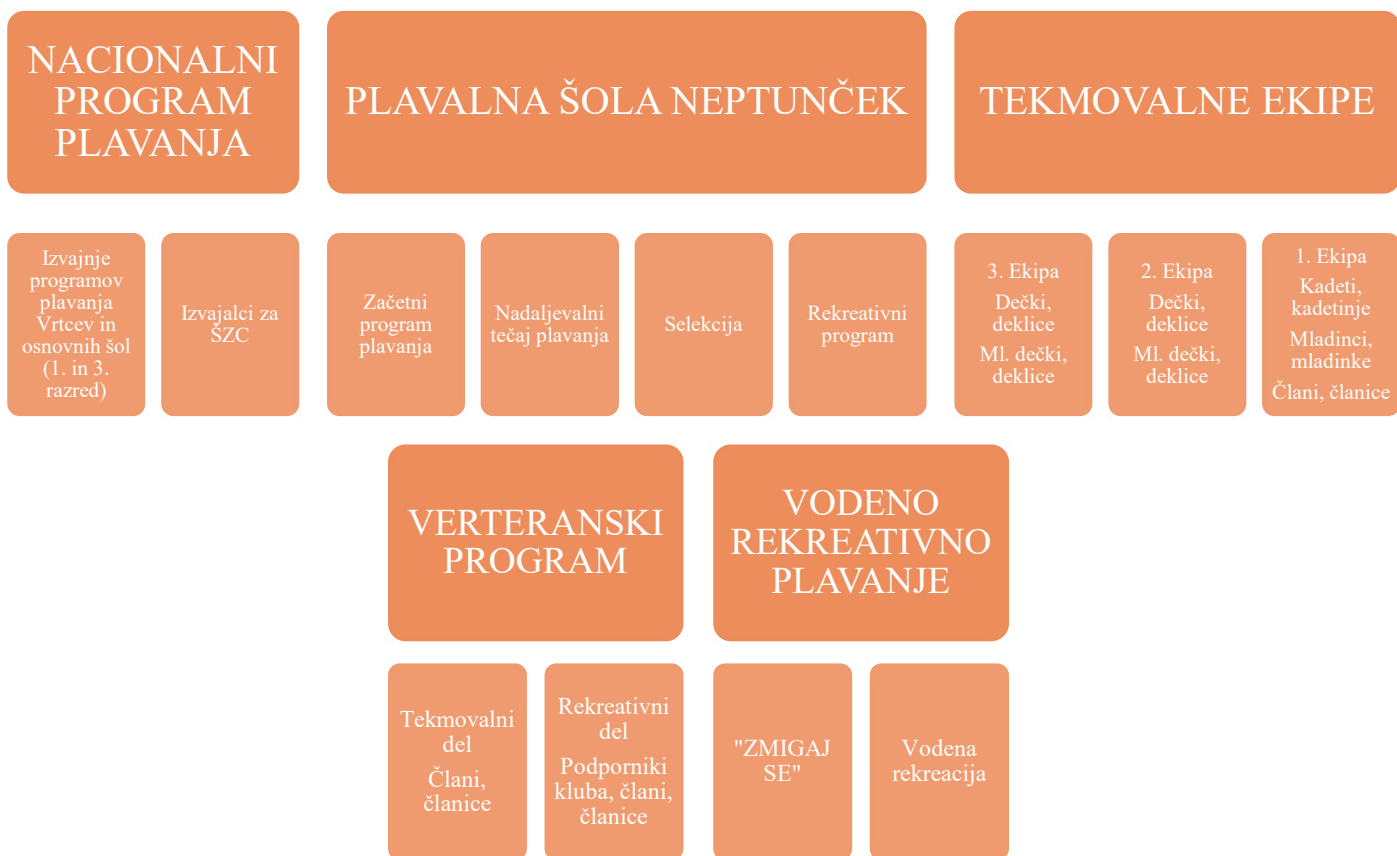
Slika 1.: Strukturni prikaz programov plavanja v plavalnem klubu Neptun Celje

Klub nudi tudi vodeno rekreativno plavanje za starostno kategorijo od 18 do 55 leta, ki je del programa »Zmigaj se«, štirikrat tedensko. Na področju veteranskega plavanja klub nudi dve možnosti in več terminov treninga, in sicer rekreativno in tekmovalno plavanje. Klub podpira tekmovalno veteransko plavanje tako v smislu prilagojenega trenažnega procesa, kot tudi ob prijavi na veteranska tekmovanja po Sloveniji in v tujini.